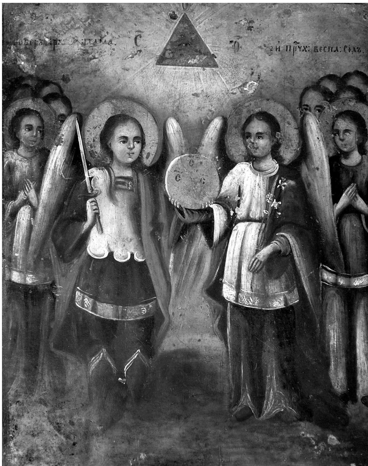
Фото 6. Верх аналая для Євангелія у апсиді з іконою "Собор архангелів пресвятих безплотних сил". XIX ст. Дерев'яна УПЦ МП Святого Архистратига Михаїла, 1914 р. с. Перебиківці Заставнівського р-ну Чернівецької обл. 27 червня 2007 р.