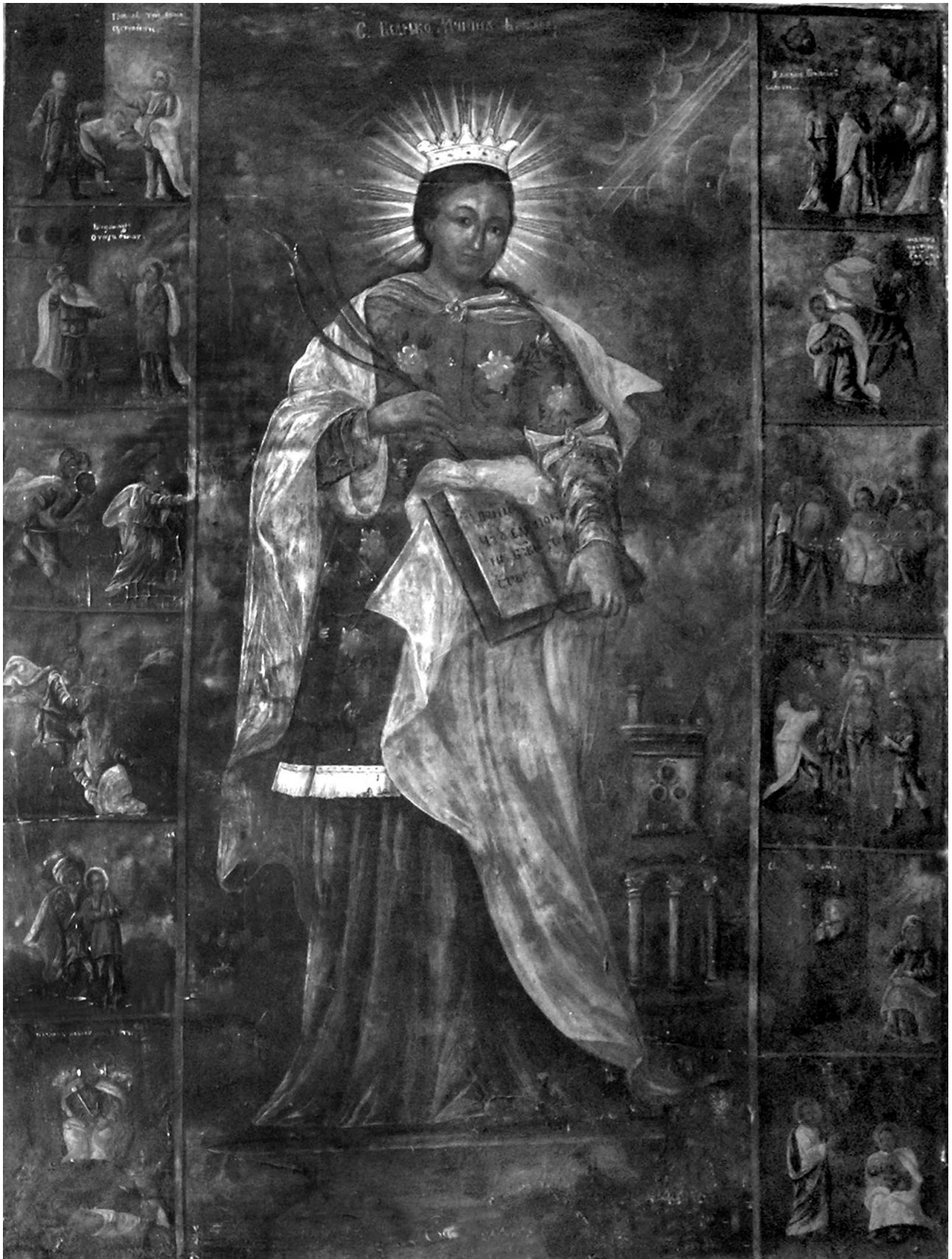
Фото 7. Ікона "Св. влчч Варвара з житієм". 1840 р (?) – напис. Дерев'яна УПЦ МП Святого Архистратига Михайла, 1914 р. с. Перебиківці Заставнівського р-ну Чернівецької обл. 27 червня 2007 р.