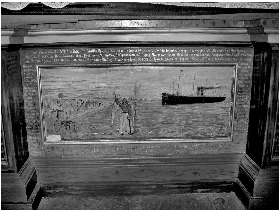
Фото 2. Ікона "Місіонерство" (?) на пределлі бічного вітваря кін. XIX – поч. XX ст. бабинця (пд) з написом. Мурована УПЦ КП св. влмч. Дмитрія, 1887 р. с. Брідок Заставнівського р-ну Чернівецької обл. 25 червня 2007 р.