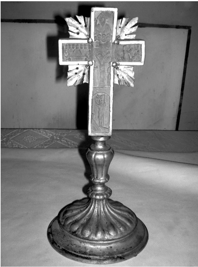
Фото 3. Напрестольний хрест (аверс). Кінець XIX ст. Композиція “Розп’яття”: вгорі – благословляючий Бог-Саваоф над хмарами; лівий кінець – Тайна Вечера з Ісусом Христом та вісьмома апостолами; у центрі – розп’ятий Ісус Христос з пів-фігурами пристоячих, праворуч – моління про Чашу. Внизу композиції в арковидному просвіті – Воскресіння Господнє. Кінець XIX ст. Мурована УПЦ КП Святого Архистратига Михаїла, 1892 р. с. Мосорівка Заставнівського р-ну Чернівецької обл. 26 червня 2007 р.