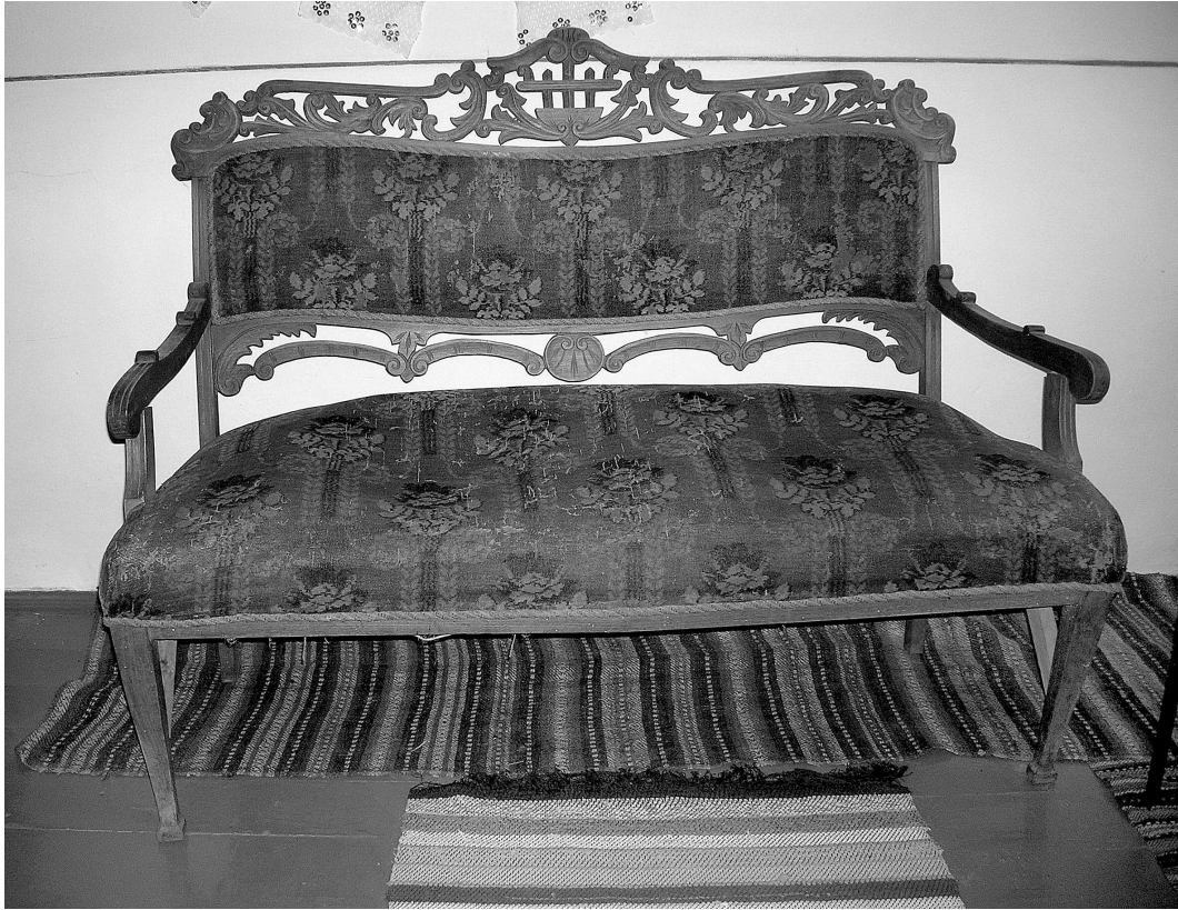
Фото 1. Софа. Кін. XIX – поч. XX ст. Габарити: ширина 119 см, висота 98 см, висота сидіння 41 см, глибина 45 см. Погорілівський музей села при середній школі. Село Погорілівка Заставнівського р-ну Чернівецької обл. 23 червня 2007 р.