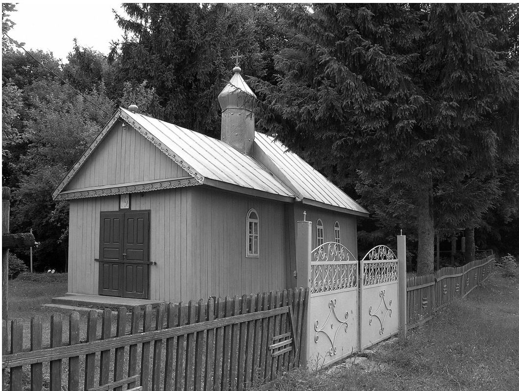
Фото 8. Фасад церкви (пд-зх). Дерев'яна УПЦ МП Пресвятої Трійці, 1935 р. с. Блищадь Хотинського р-ну Чернівецької обл. 28 червня 2007 р.