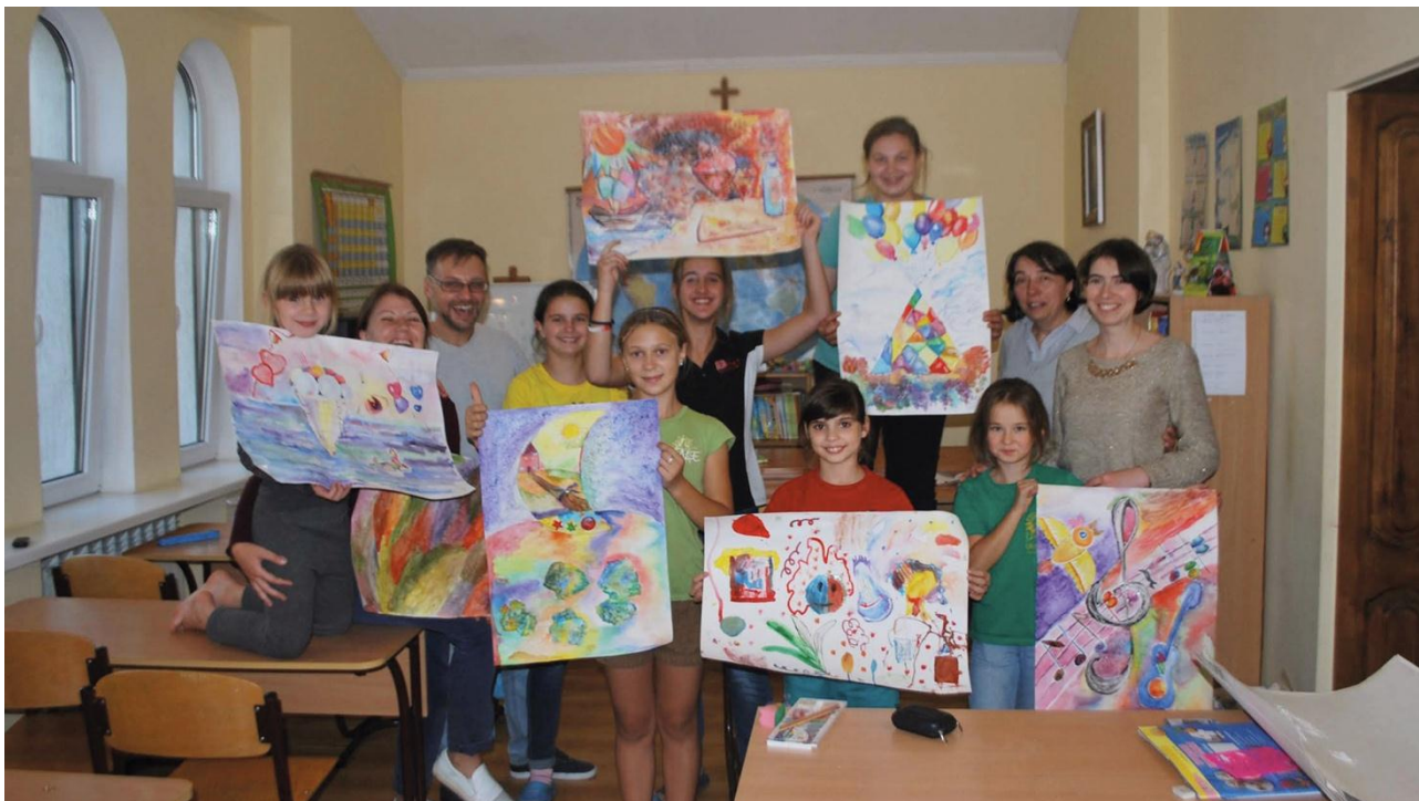
Лл. 2. Учасники інклюзивної програми «Арт-палітра» у рамках Проєкту «ПРОСТО НЕБИЛИЦІ»-2017 та волонтери ГО ЦКМІ після майстерки у техніці акварелі у Дитячому будинку «Надія» с. Бірки. 8.09.2017 р.

традиційно дарують художній реманент, іграшки, частують солодощами (Лл. 2).