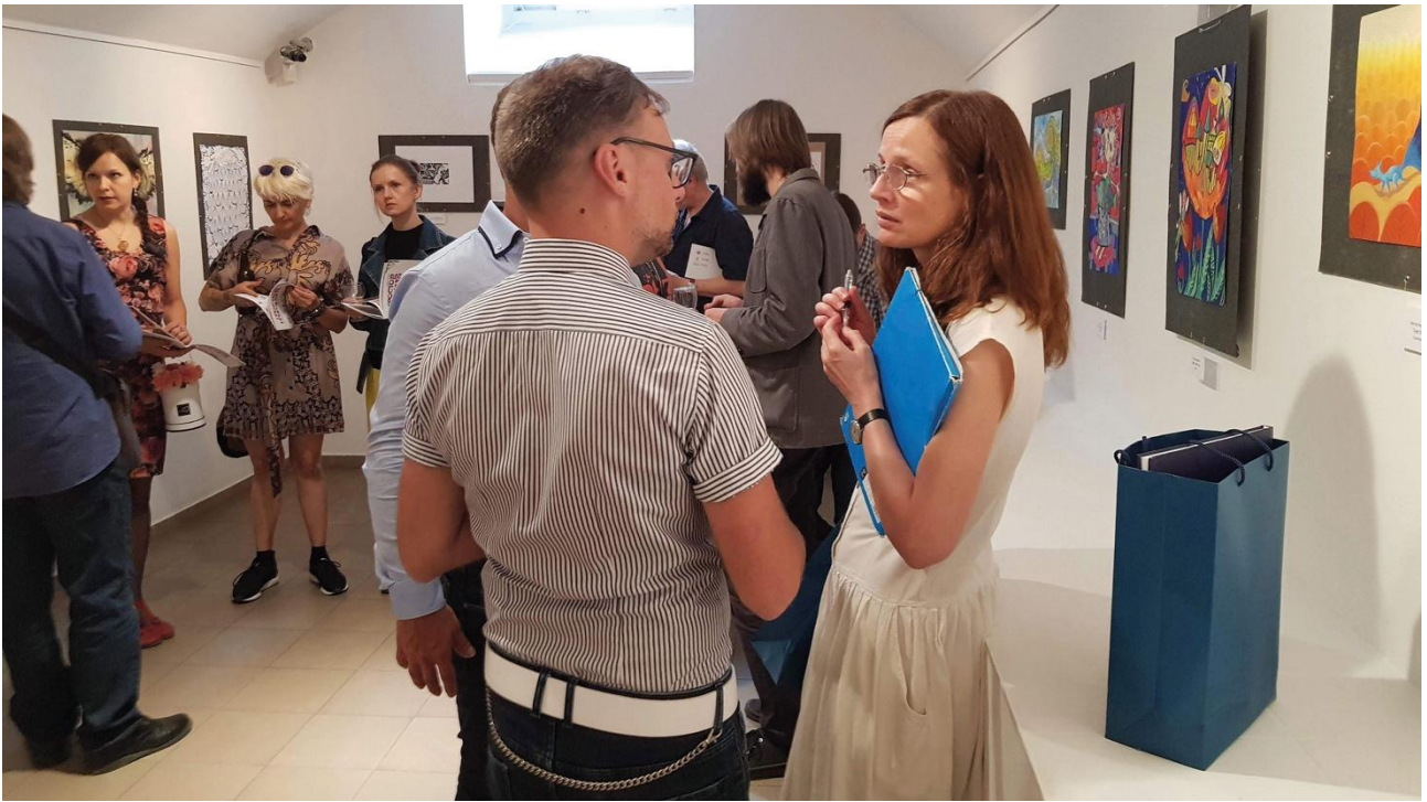
Лл. 5. Урочистий фінісаж Всеукраїнського проекту для молодих митців «ПРОСТО НЕБИЛИЦІ»-2018 у Арт-галереї Краківського університету Комісії національної освіти. 19.07.2019 р.

Унікальним форматом Проекту є його інклюзія. Щорічна колекція «ПРОСТО НЕБИЛИЦІ» поповнюється художніми роботами осіб з особливими потребами, відтак відкриває світові їхні результати креативних пошуків.