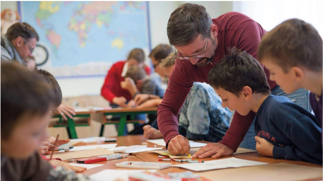
Іл. 1. Учасники інклюзивної програми «Арт-палітра» у рамках Проекту «ПРОСТО НЕБИЛИЦЬ»-2015 та волонтери ГО ЦКМІ на майстерці у техніці олійної пастелі у «Родинному домі «Покрова» м. Львова. 20.10.2015 р.

склад якої щорічно повністю оновлюється, експозиційній діяльності у країні та за кордоном. Такий доволі виразний діапазон заангажованості організаторів у Проект обумовлює широту діяльності арт-менеджменту. Осердям «ПРОСТО НЕБИЛИЦЬ» є залучення у культурно-мистецький процес юних учасників віком від 5 до 16 років не тільки з творчих інституцій країни, а й інклюзія охочих взяти участь, котрі мешкають в осередках для осіб, позбавлених батьківської опіки та з особливими потребами (Іл. 1).